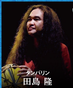
タンバリン 田島隆

世界で最も珍しいタンバリン専門の演奏家。独自の演奏方法や楽器制作などかつてない方法論で音楽を表現。