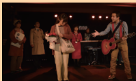
『矢柄志探偵の大学爆破予告事件』 (2022年2月)