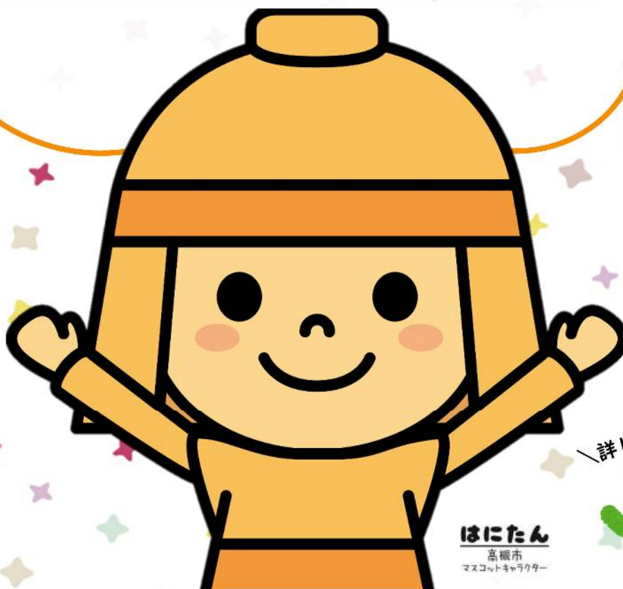
ほにたん 高槻市 マスコットキャラクター