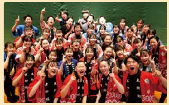
京都橘中学校・高等学校 太鼓部 (京都市伏見区)