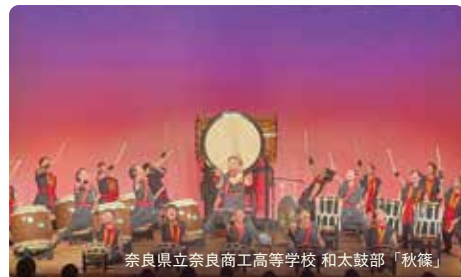
奈良県立奈良商工高等学校 和太鼓部「秋篠」