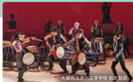
大阪府立芥川高等学校 和太鼓部