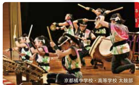
京都橘中学校・高等学校 太鼓部