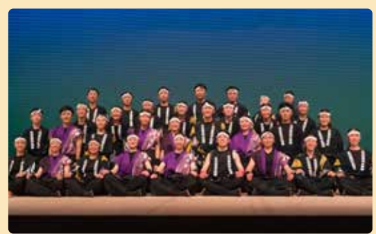
大阪府立芥川高等学校 和太鼓部 (大阪府高槻市)