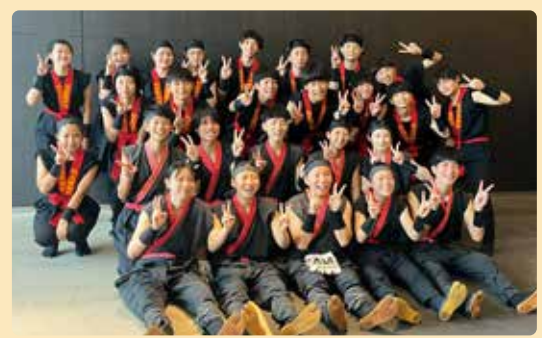
奈良県立奈良商工高等学校 和太鼓部「秋篠」 (奈良県奈良市)